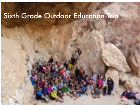
Sixth Grade Outdoor Education Trip